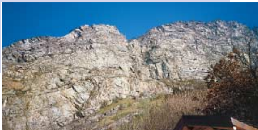
La paroi des Follatères depuis le parc

2. Isotis , 7a (6a+ obl.). C. et Y. Remy, février 1997. La longueur en 6c est tout aussi exceptionnelle, le 7a très court.